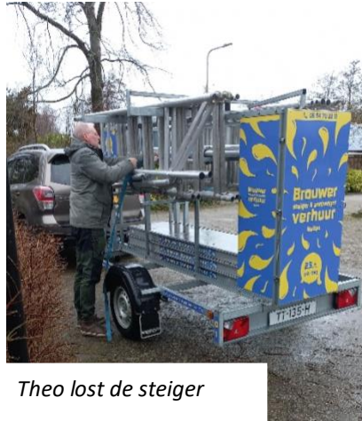
Theo lost de steiger